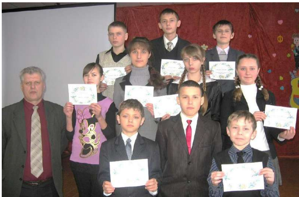
Школьная навукова-практычная канферэнцыя 2012 год