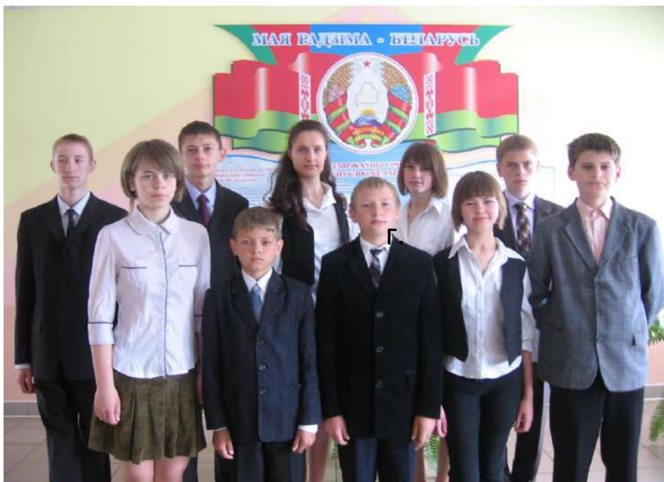
Удзельнікі навуковага таварыства вучняў “КВАНТ”