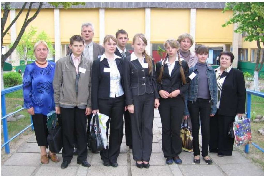
Каманда Даўгінаўскай СШ на раённай навукова-практычнай канферэнцыі 2012 год