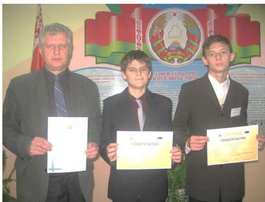
Удзельнікі конкурсу даследчых работ вучняў устаноў адукацыі Мінскай вобласці 2012 год