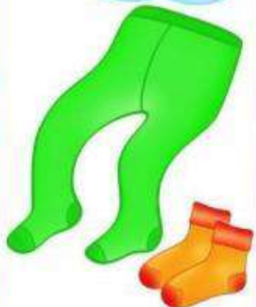
КАЛГОТКИ І ШКАРПЭТКИ