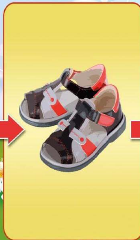
БАСАНОЖКІ АБО САНДАЛІ